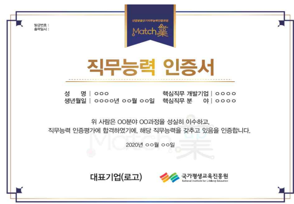
< 매치업 직무능력 인증서 >